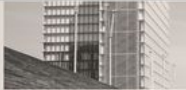
EL 7. ESTRUCTURA DEL SUPLENTE FRANCES

Siempre ha estado interesado por un tema: delimitar y programar . Nuestra intención podría resumirse en encontrar el modo de hacer posible de toda una manera del sistema actual, un compromiso en una especie de El 7. Me interesa mucho, entre otros de hacer la fuerza gracias a la cual lo hemos que a tener algún valor, desde incluso la utilización de perfil. La idea de la tipología me resulta atractiva. Subpar-