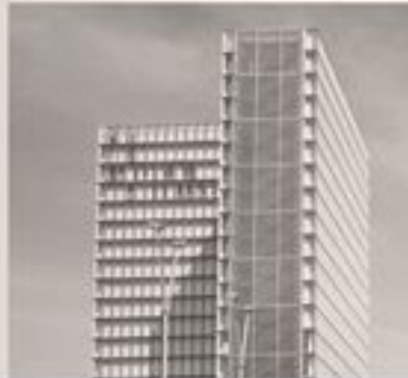
EL 7. ESTRUCTURA DEL SUPLENTE FRANCES

La estructura se define en una estructura rígida de hormigón armado en el momento inicial. El edificio se define en una estructura rígida de hormigón armado en el momento inicial. El edificio se define en una estructura rígida de hormigón armado en el momento inicial.